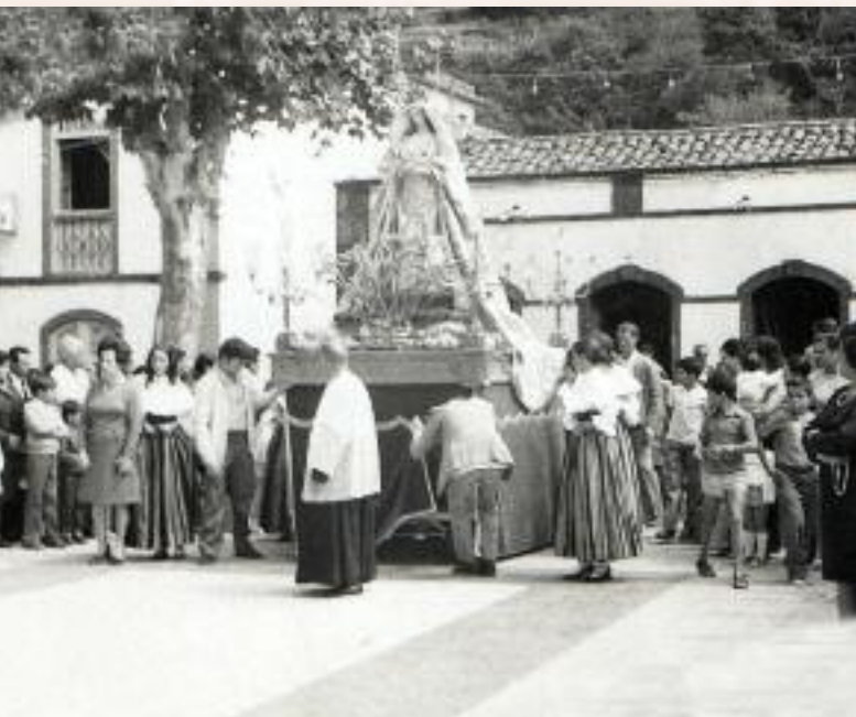
La Virgen regresa a la Plaza tras su recorrido procesional. Domingo, 1 de octubre de 1972.

benéficos más necesitados de la Isla; también para los más desfavorecidos de la Parroquia.