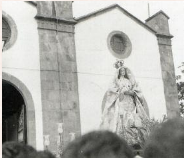
Procesión de la Virgen. Domingo, 1 de octubre de 1972.

Material gráfico y texto: Vicente Rodríguez Suárez