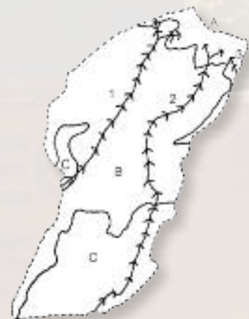
Mapa. Caminos y zonación prehispánica

Podemos citar tres caminos de tránsito desde las zonas de medianías hasta la cumbre, caminos que servirían para una trashumancia estacional que practicaban los aborígenes en la isla de Gran Canaria, son: el camino de Teror a la cumbre, que pasaría por el barranco de Madrelagua, Calderetas y Peñones; el camino de Fírgas a la cumbre, atravesando el Barranco de la Virgen, Valsendero y el Andén; y por último el camino de Gáldar a la cumbre, atravesando el barranco del Gusano, Pinos de Gáldar hasta alcanzar las faldas de Montañón Negro, donde contacta con el municipio de Valleseco (Mapa). La existencia de los caminos implica la instalación de campamentos semipermanentes en las zonas de pastoreo y a lo largo del camino, Las Cuevas del Andén probablemente fueron uno de estos campamentos.