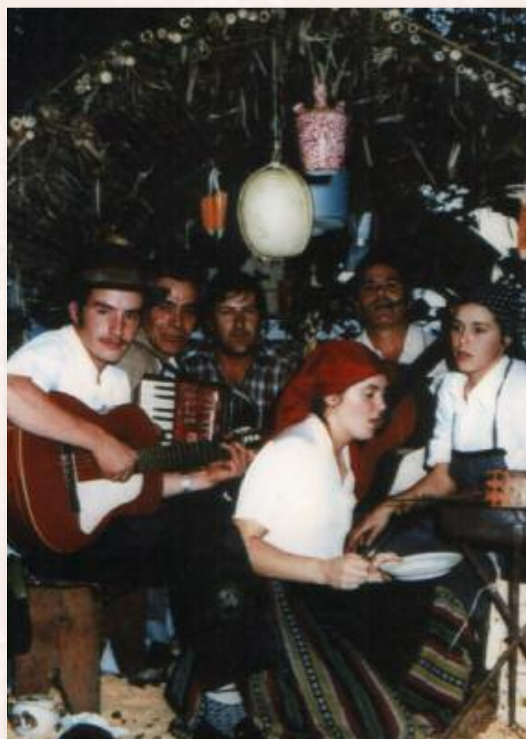
Grupo de vecinos del barrio de Troyanas en una de las primeras representaciones de la ofrenda.