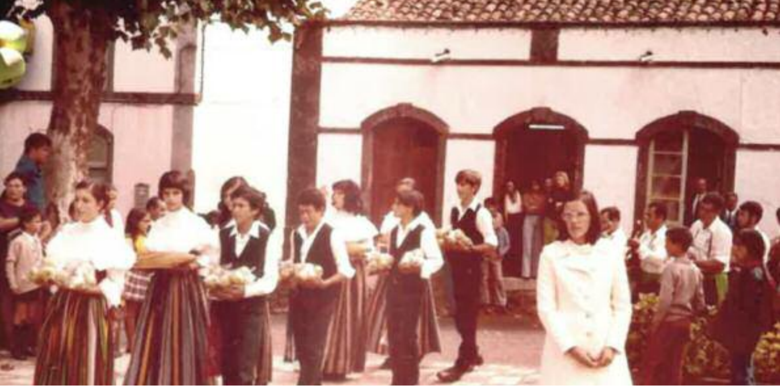
Imagen de la primera ofrenda a la Virgen de la Encarnación. Año 1974.