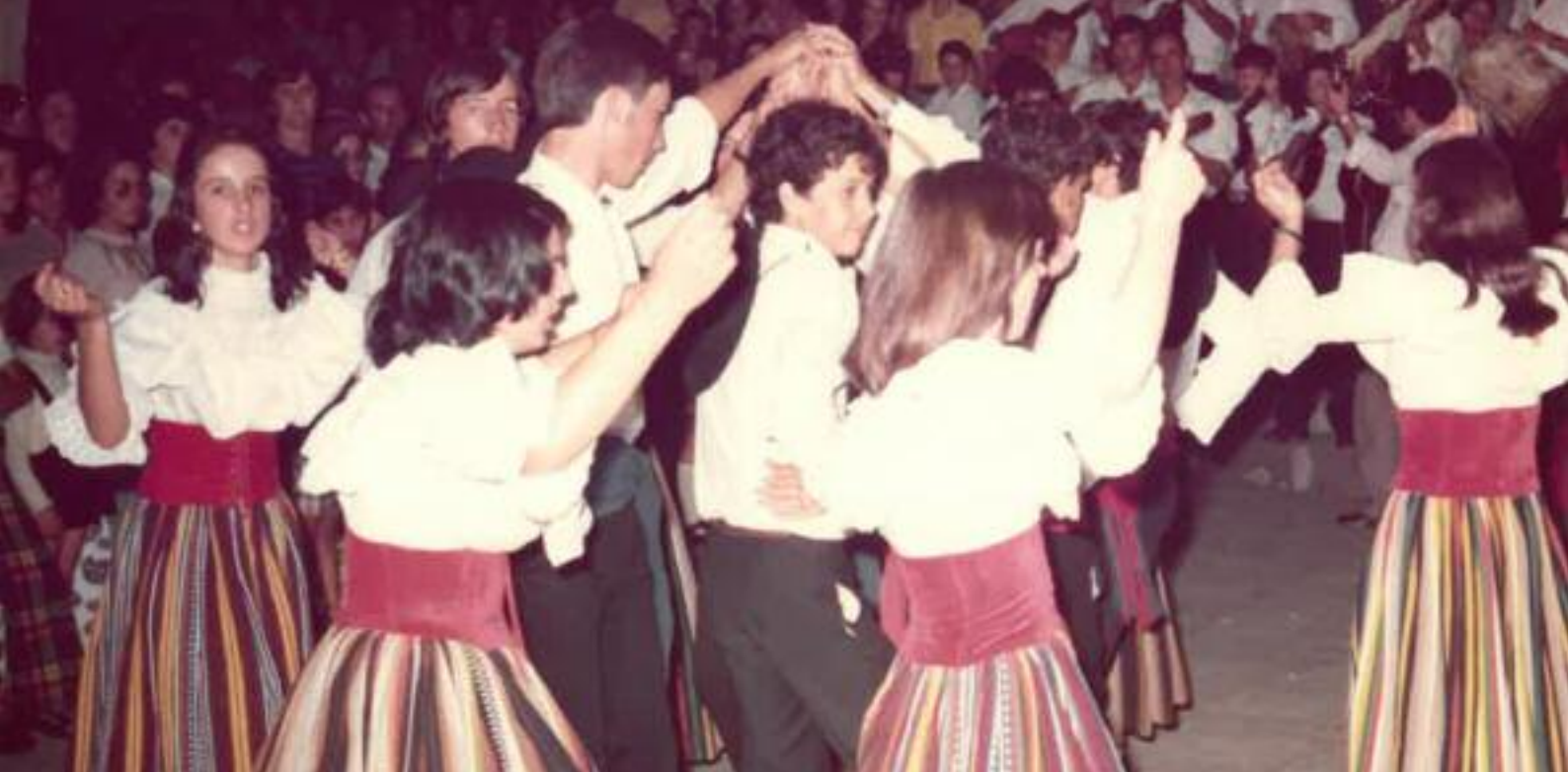
Niños bailando en la romería de la Encarnacion. Año 1975.

pintor y funcionario del Cabildo Insular de Gran Canaria.