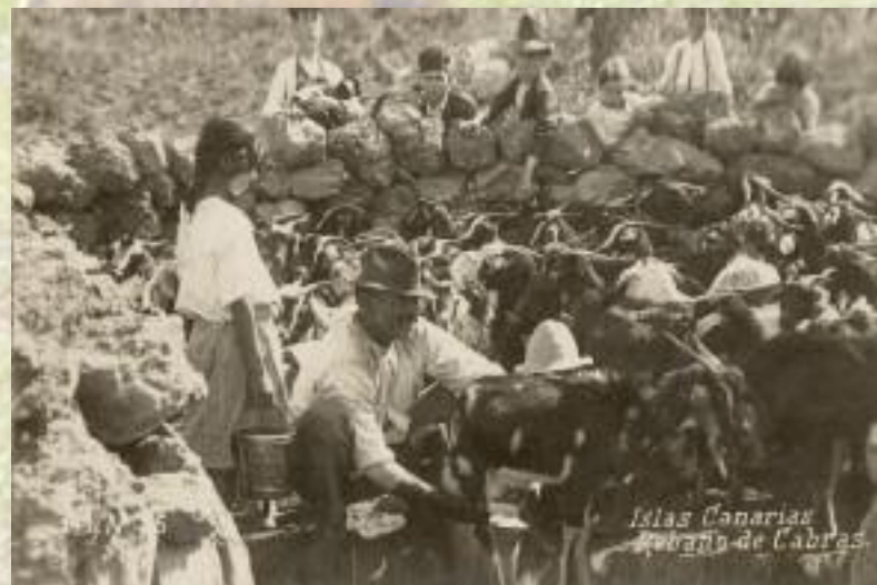
Rebaño de cabras en un corral. Tarjeta postal no circulada. Año de creación: C. 1935-1940.

El pastor de Gran Canaria, cada vez más convertido en ganadero, ya que cría cabezas que no siempre pastorea, trabaja con tres tipos de animales: cabras, ovejas y vacas, en una distribución acorde con los pisos climáticos y vegetales que son los idóneos. En los dos primeros casos, se trata de razas canarias; en el tercero, la vaca de la tierra va quedando relegada a su cría sólo porque el ganadero le