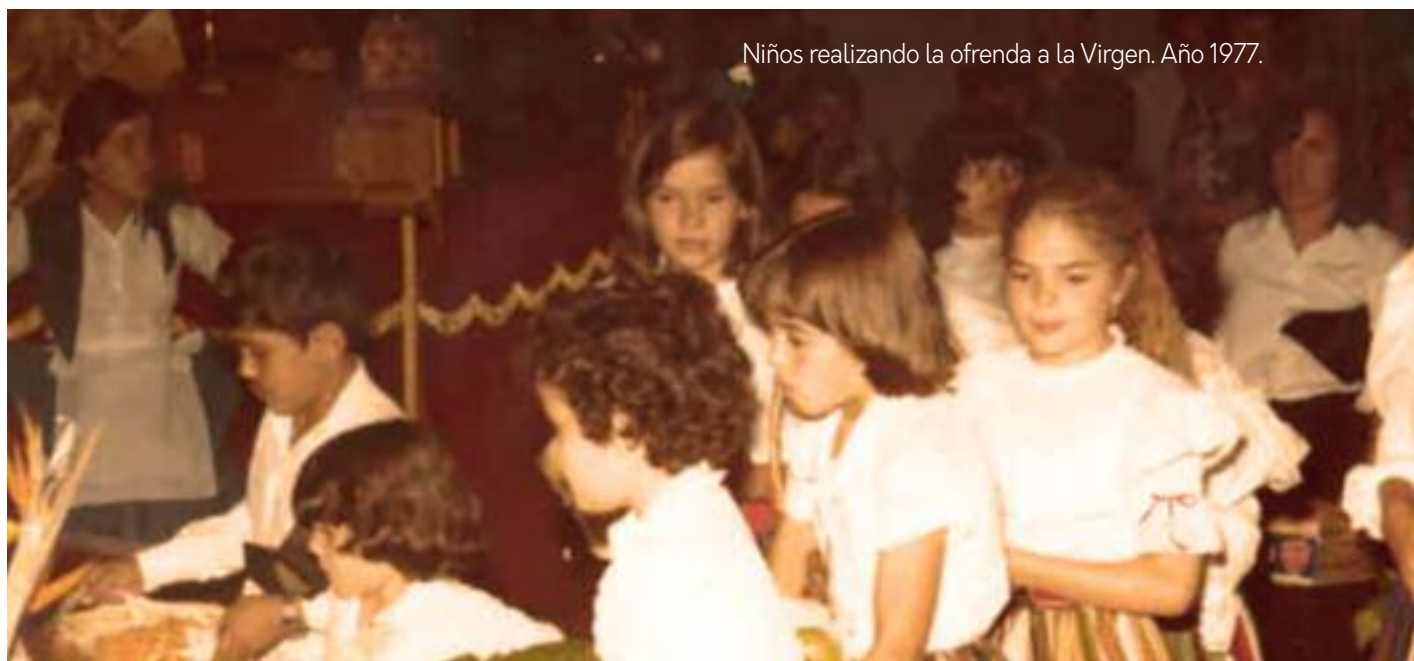
Niños realizando la ofrenda a la Virgen. Año 1977.